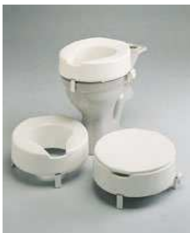
NÁSTAVEC NA WC