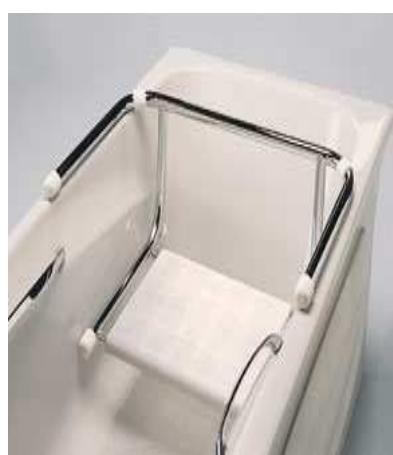
SEDÁK NA VANU