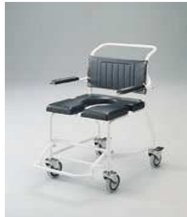
KŘESLO DO SPRCHY